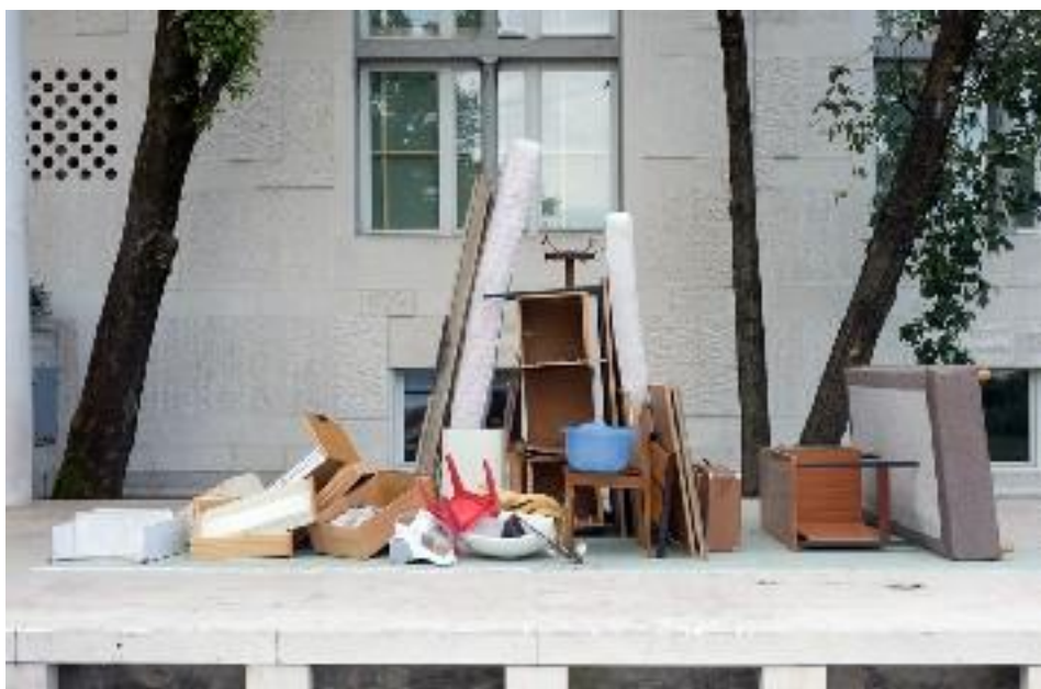
Tadej Pogačar, Socialna skulptura , 2010

Ravno v tem pa je bistvo sodobne umetnosti.