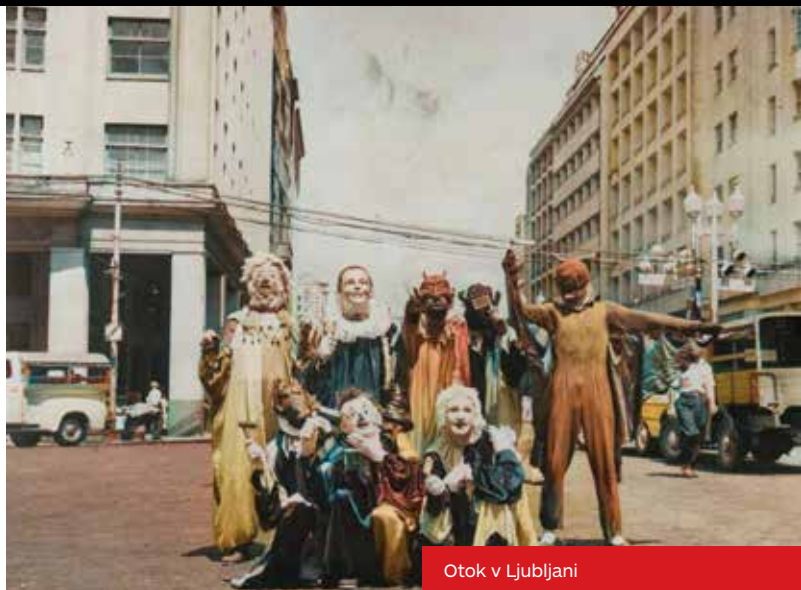
Otok v Ljubljani