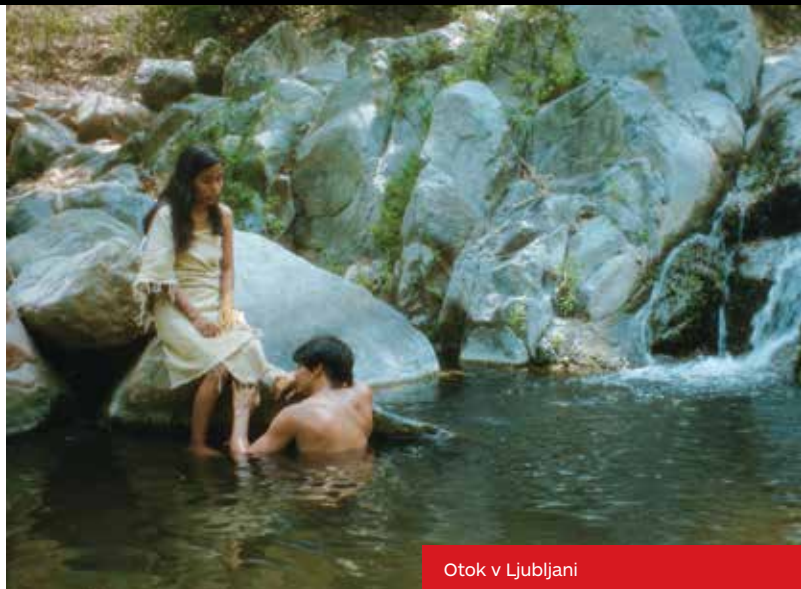
Otok v Ljubljani

Zanimati sem se začel tudi za ptice, za njihovo letenje in svobodo. Za to, kako se selijo iz enega kraja v drugega, ne da bi jih skrbelo za meje, navade ali bančne račune. In čeprav imajo podnebne spremembe vse hujše posledice prav za ptice, se te še naprej selijo in razmnožujejo. Zdi se mi, da posedujejo nekakšno modrost, tisočletno in skrivnostno, ki je ljudje ne poznamo. Nekatere ptice lahko letijo dvanajst dni, ne da bi se dotaknile tal. Dvanajst celih dni, ne da bi jedle. Spijo in sanjajo v podobah, polnih zagonetk. Njihove sanje