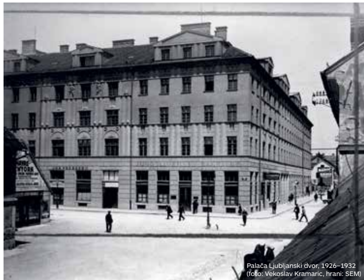
Palaca Ljubljanski dvor, 1926–1932