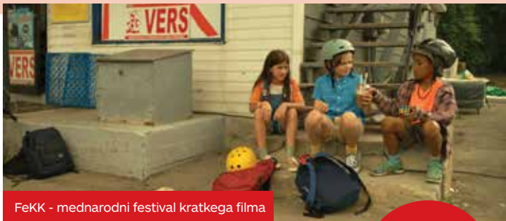
FeKK - mednarodni festival kratkega filma