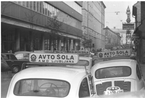
Fotografija: Marjan Ciglič, 1975, Muzej novejšje zgodovine Slovenije.

Z razstavo Slovanska knjižnica - Center za domoznanstvo in specialne humanistične zbirke iz svojih bogatih gradiv predstavlja nekdanjo podobo in kulturno dediščino ljubljanskih ulic in trgov, pospremljeno s kolažem sodobnih fotografij. Skozi razstavo si bo moč ogledati in prebrati marsikaj o zgodovini ljubljanske ulice, ki se imenuje po bližnjem kolodvoru, poleg drugih ustanov, ki domujejo na njej, pa bo omogočala tudi vpogled v zgodovino ljubljanskega kina - današnjega mestnega kina Kinodvor, ki letos obeležuje 90. obletnico nastanka.