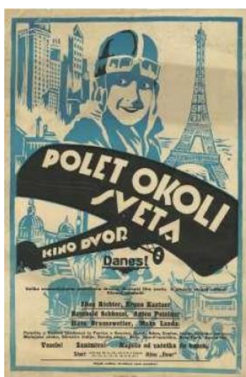
Filmski plakat Polet okoli sveta ( Der Flug um den Erdball , Willi Wolff, Nemčija, 1925)

oblikovanje: Peter Kocjančič Razstava