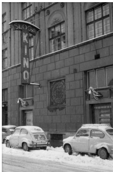
Fotografija: Marjan Ciglič, 1965, Muzej novejšje zgodovine Slovenije.

Razstavo je prijazno omogočil Muzej novejšje zgodovine Slovenije, ki je zanjo posredoval fotografije.