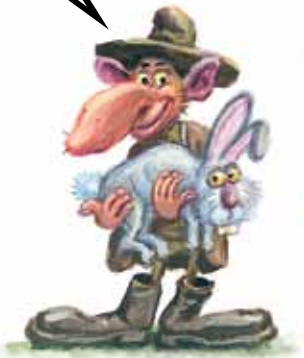
ŠKRAT S KMETIJE